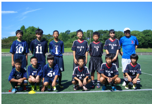
福岡県の出場チームを、町事務局長が激励。