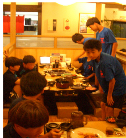
試合後のレセプションは大焼肉大会！ たっぷり食べてみんな笑顔、とにかく盛り上がりました。