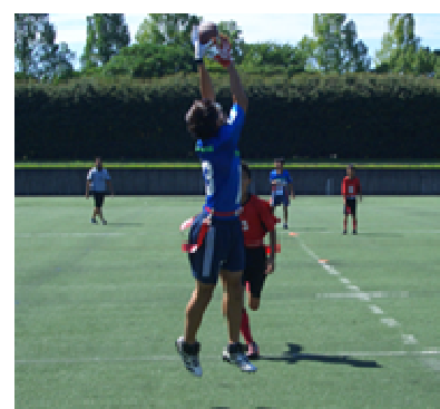
猛暑の中、試合は真剣勝負！