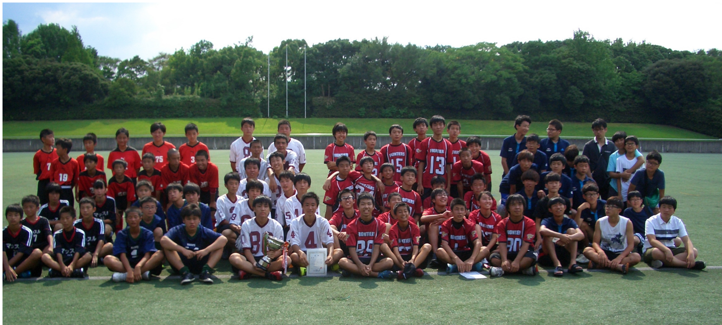
大会には韓国各地区代表2チームと日本から6チームが参加。熱戦を繰り広げました。