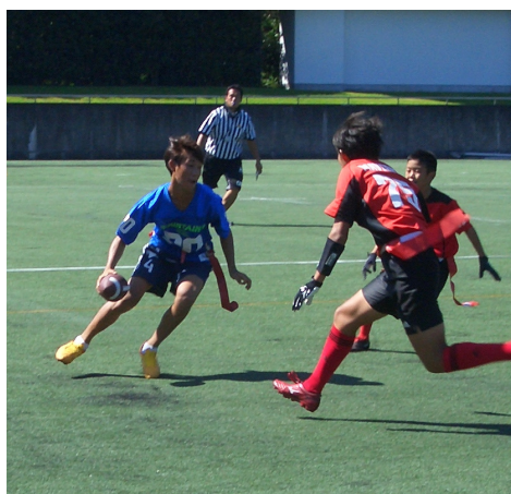
試合が始まると友好ムードは一切なし。